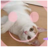
おいらのウンチはいいニオイにやか☆